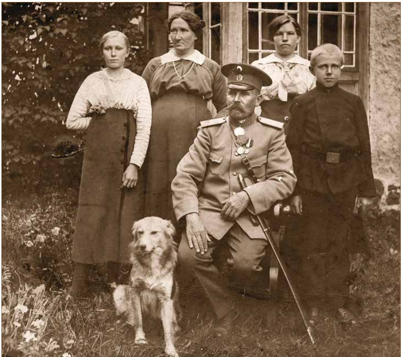
Urjädnik Vuks koduste keskel.