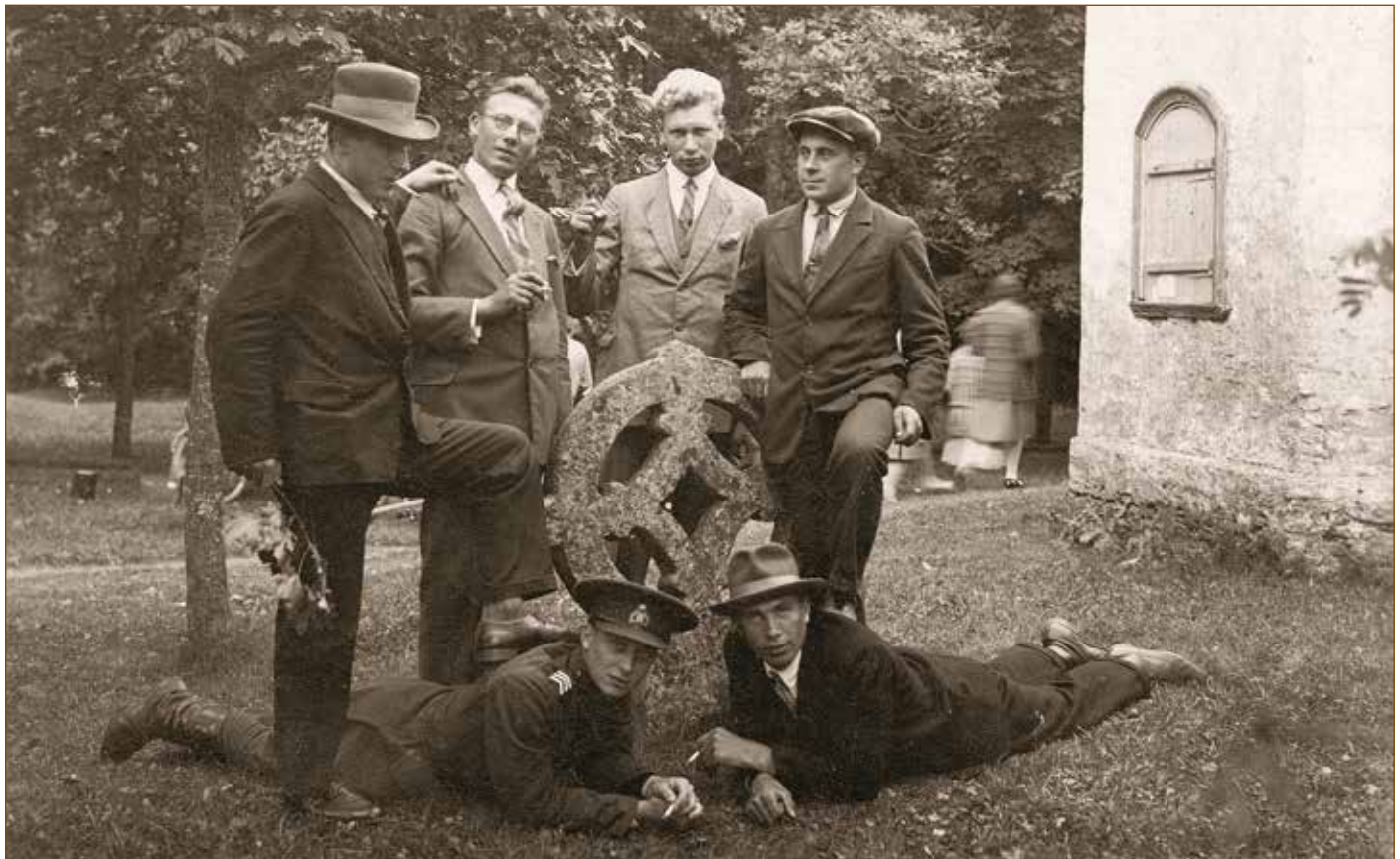
Kokuta küla mehi rõngasristi ümber ringis