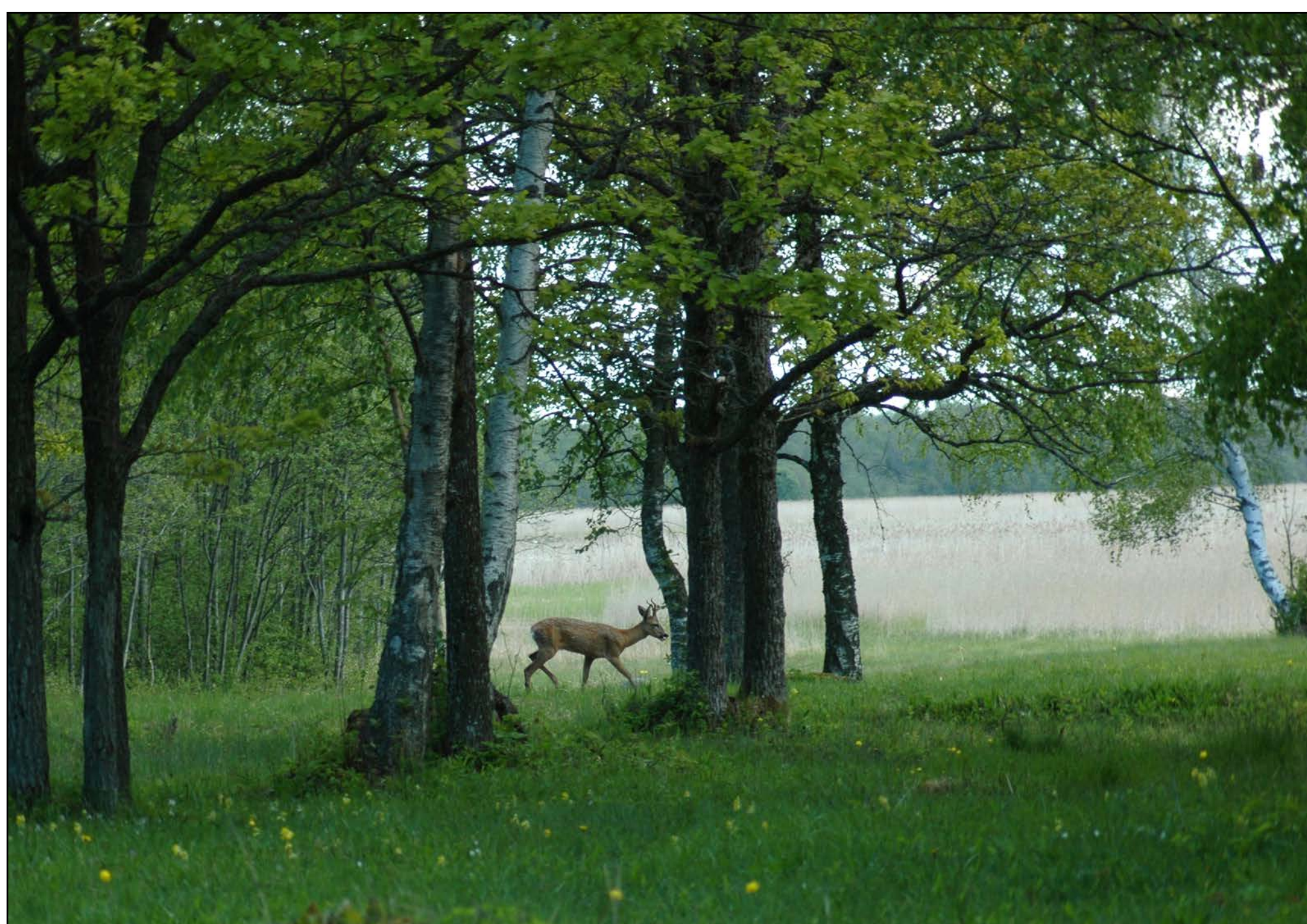
Metskits on Laelatu puisniidu tavaline asukas