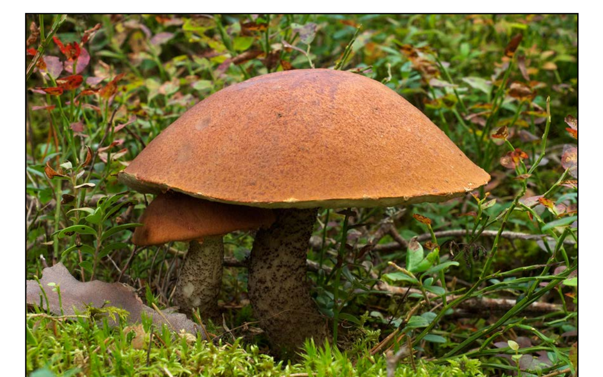
Sügis on Laelatus seeneaeg