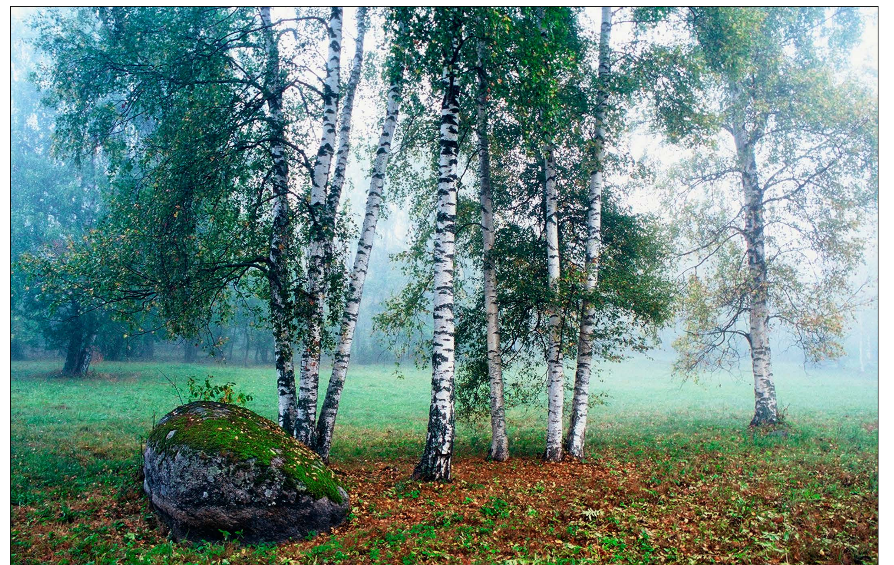
Laelatu kased udus

Ühtekokku on Laelatult leitud ligi 470 soon-taime- ja 30 sambalaliiki. Otse puisniidult on leitud 225 liiki. Siin kasvab umbkaudu 2/3 Eesti kápalistest ehk orhideedest – kokku 23 liiki. Pärast viimaste aastakümnete taastamistõid võib taas väga ohtralt leida kaunist kuldkinga, üpris sagedasti ka valget tolpead. Punast tolpead on paaris üksikus leiukohas mõned eksemplarid. Lisaks väga ohtrale hallile kápale, vööthuul-sõrmkápale ja hariilikule káoraamatule leidub küllalt palju näiteks kolme liiki neuuvaipasid ja paiguti tõmmut káppa. Huvipakkumatest liikidest võib nimetada veel kõrget kannikest, värvi-paskheina, soo-piimalille, niidu-asparhernest, emapatke, pisikannikest, ahtalehist ángelheina, rand-emajuurekest, randtarna ja láánetarna.