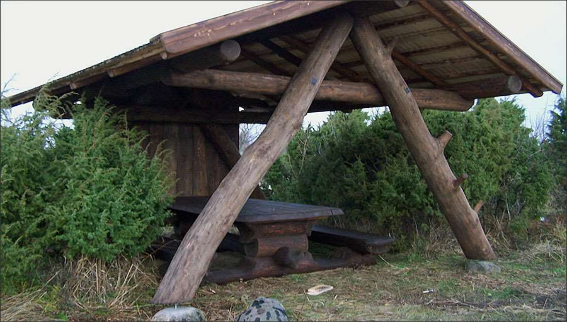
Vanaluubi puhkekoht - grillimismaja