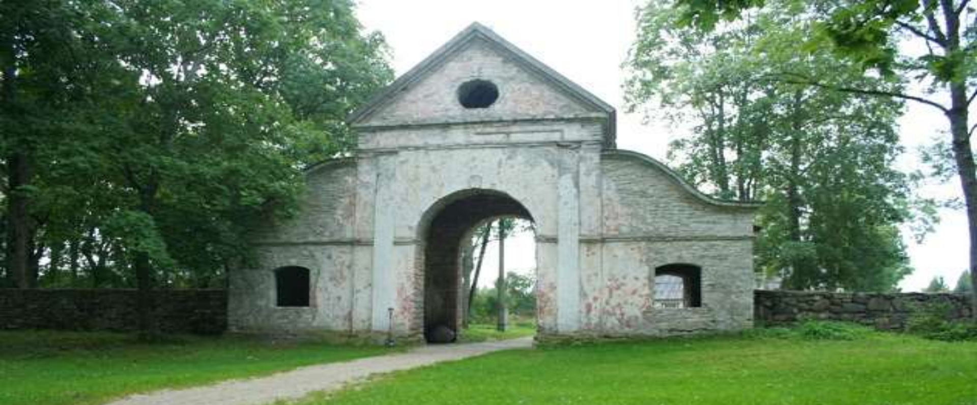
Virtsu mõisa pargi "pärl", barokkstiilis väravahoone.