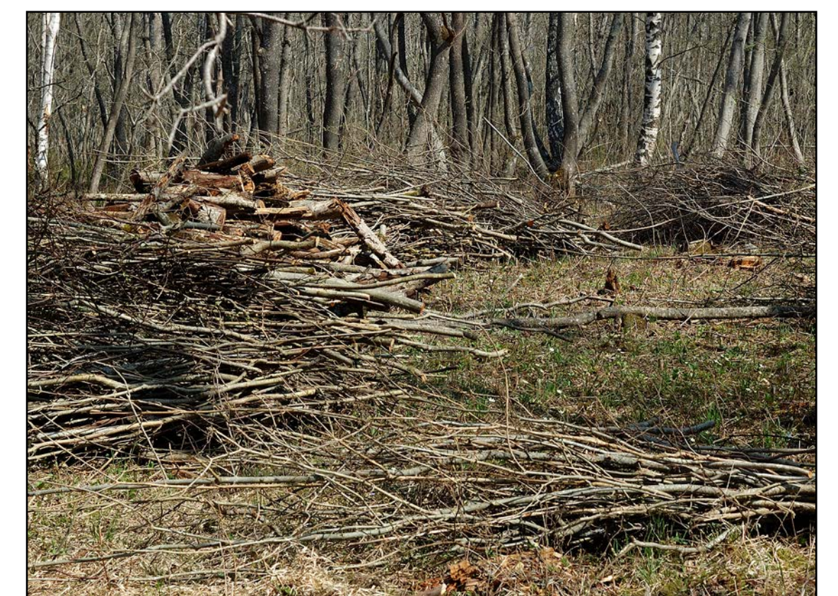
Hooldustööd Laelatu puisniidul