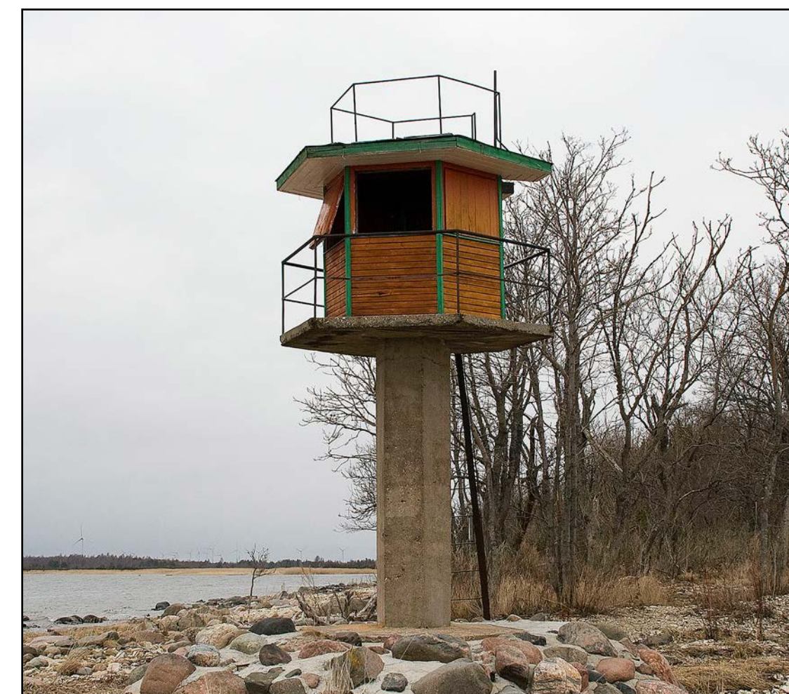
1960. aastal ehitatud linnuvaatlustorn

Virtsus on „Konsumi“ kauplus, mitmed söögikohad, kaks bensinijaama. Lähim ööbimisvõimalus on Pivarootsi tuulikus. Aeg-ajalt on ka Puhtu bioloogiajaam pakunud koha ette broneeritud juhukülalistele ööbimisvõimalust.