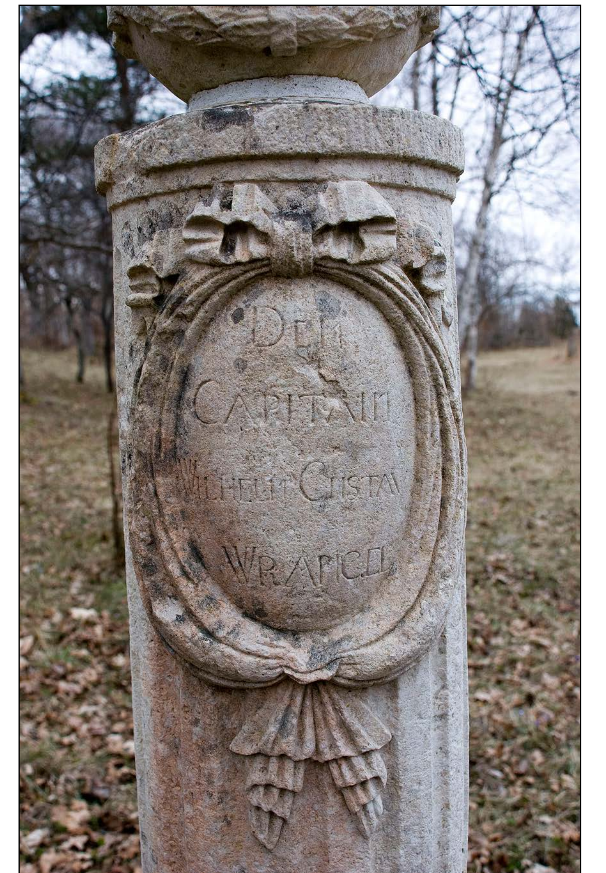
Üks säilinud monumentidest