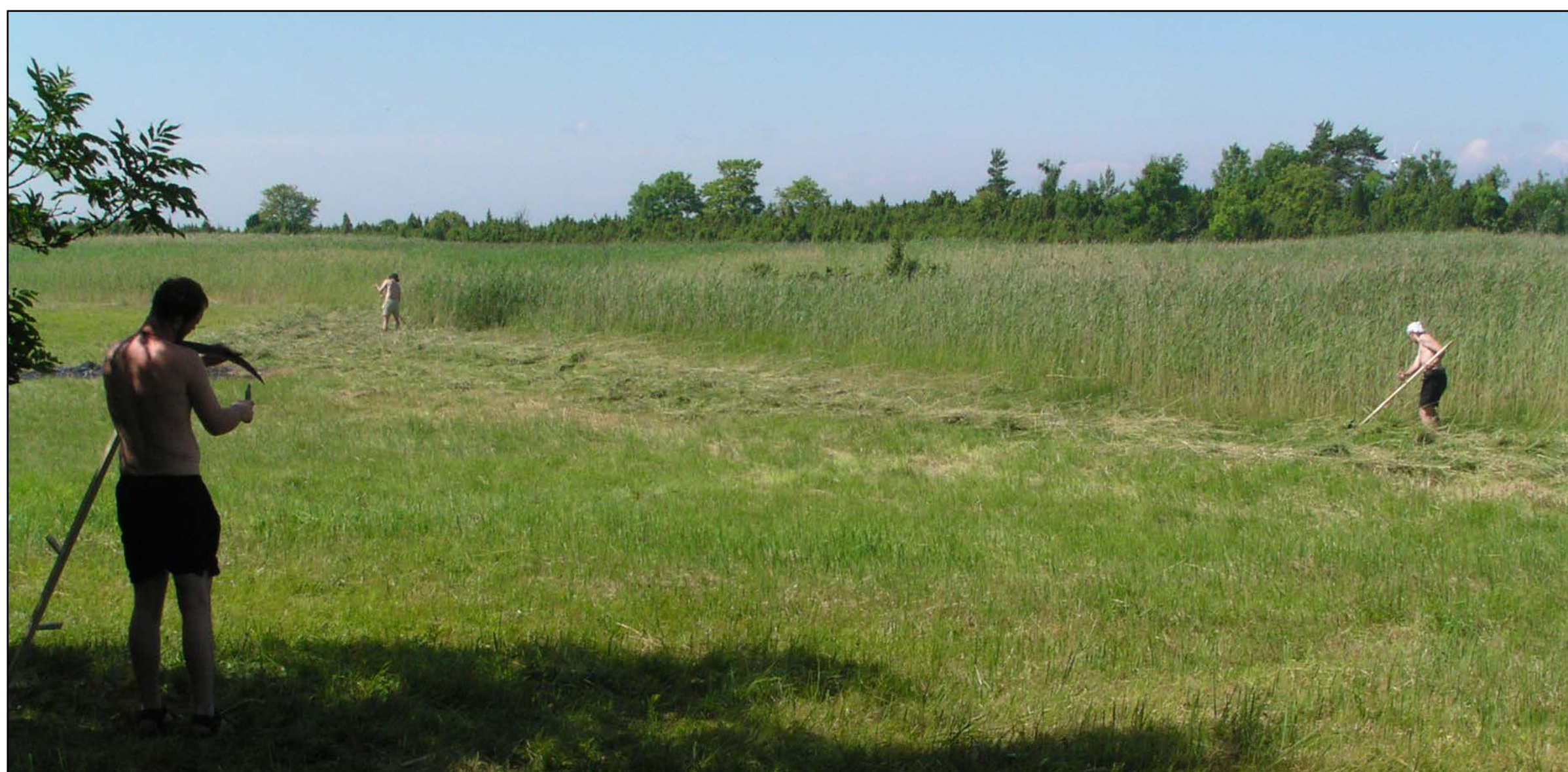
Hooldustööd Puhtu rannaniidul