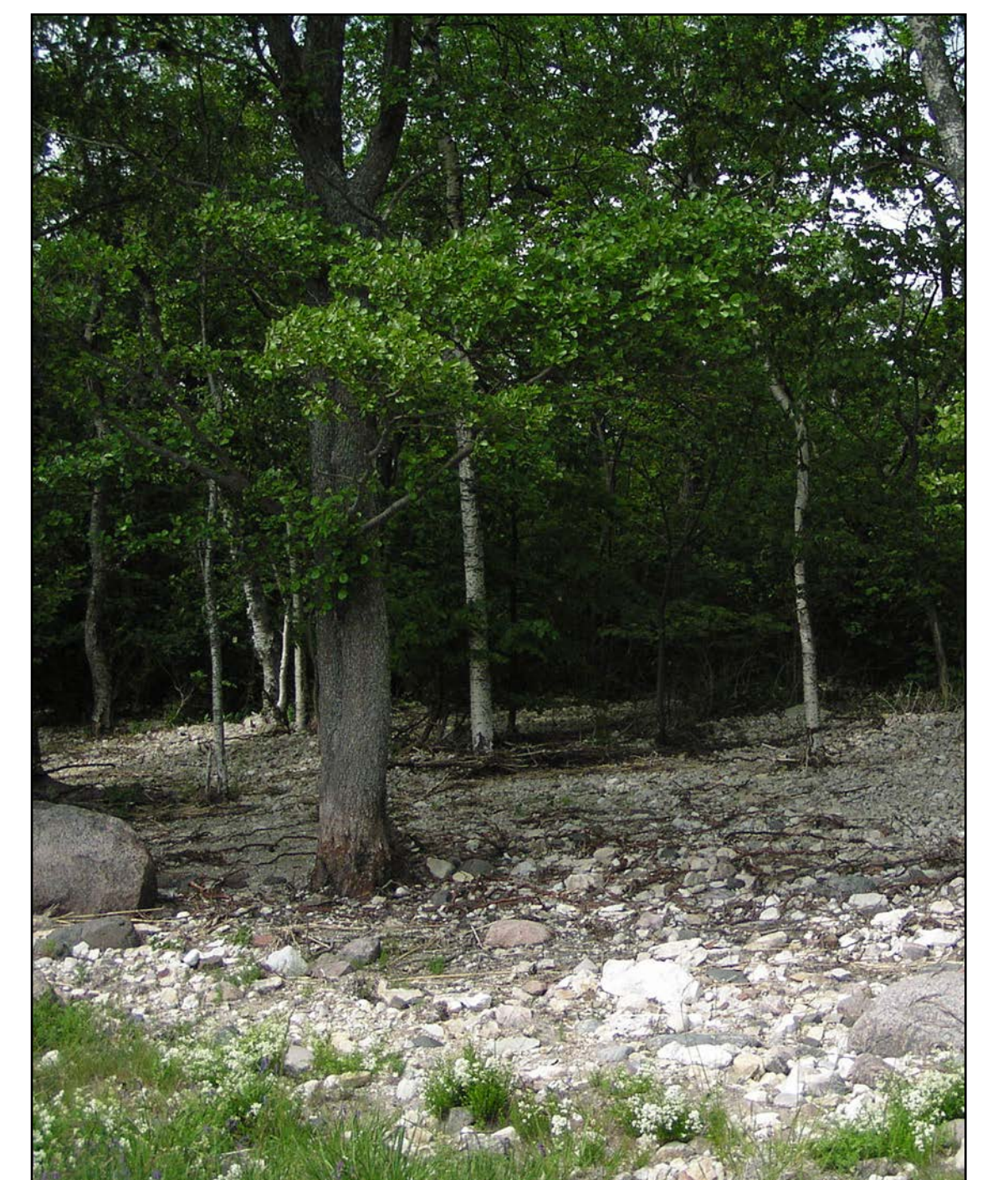
Puhtus tuleb metsaserv lausa rannaklible