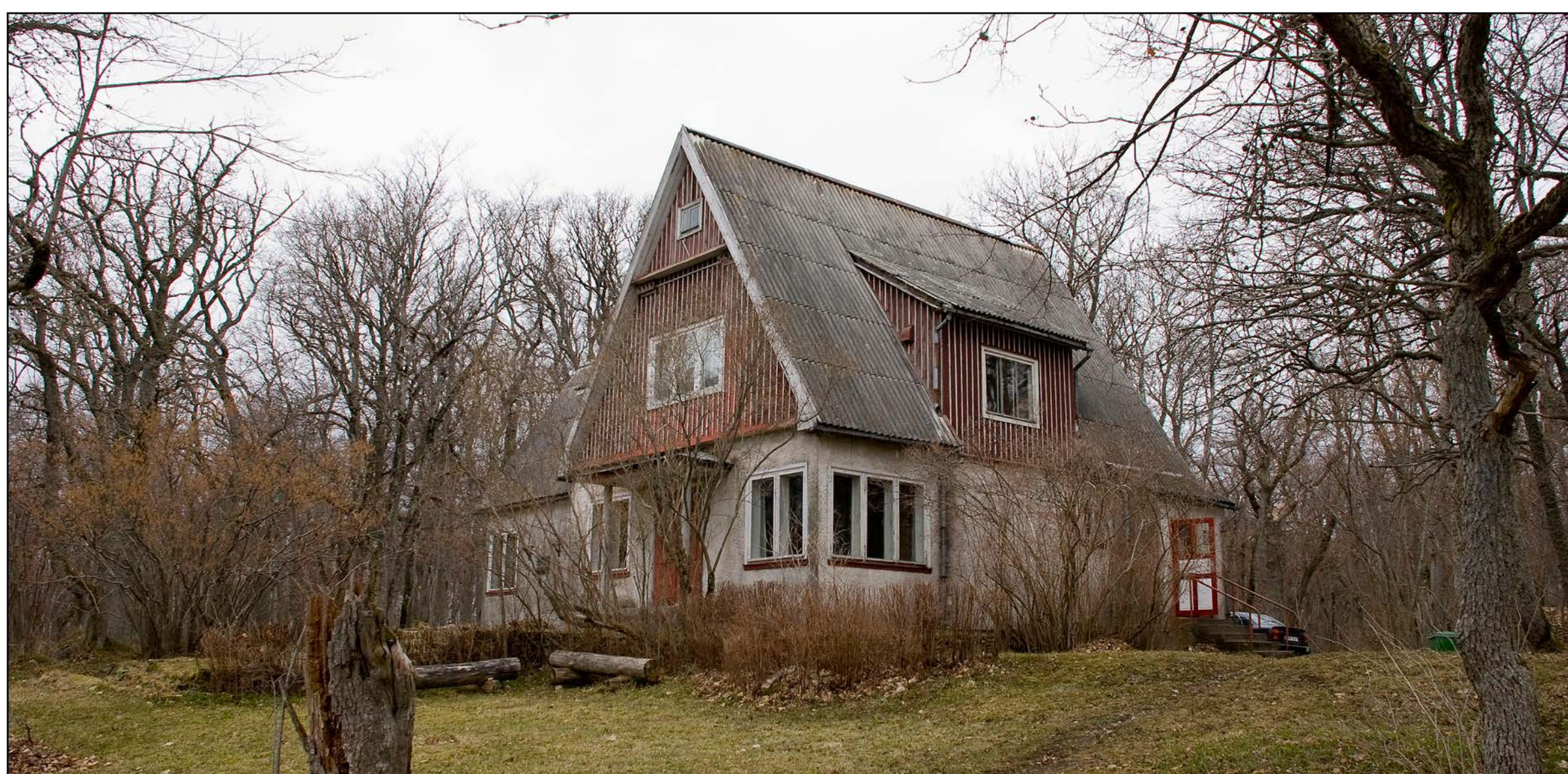
Jakob von Uexküllil endises suvemajas asub Puhtu Ornitoloogiajaam