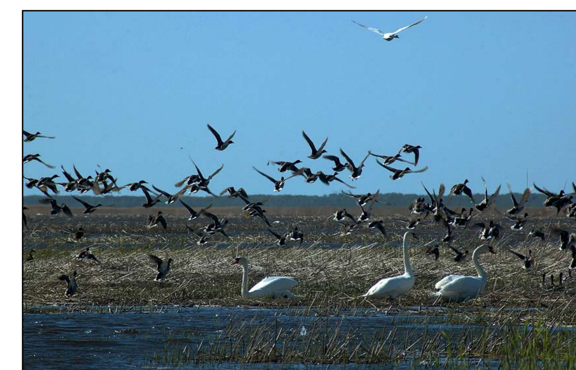
Varakevadine lindude kogunemine