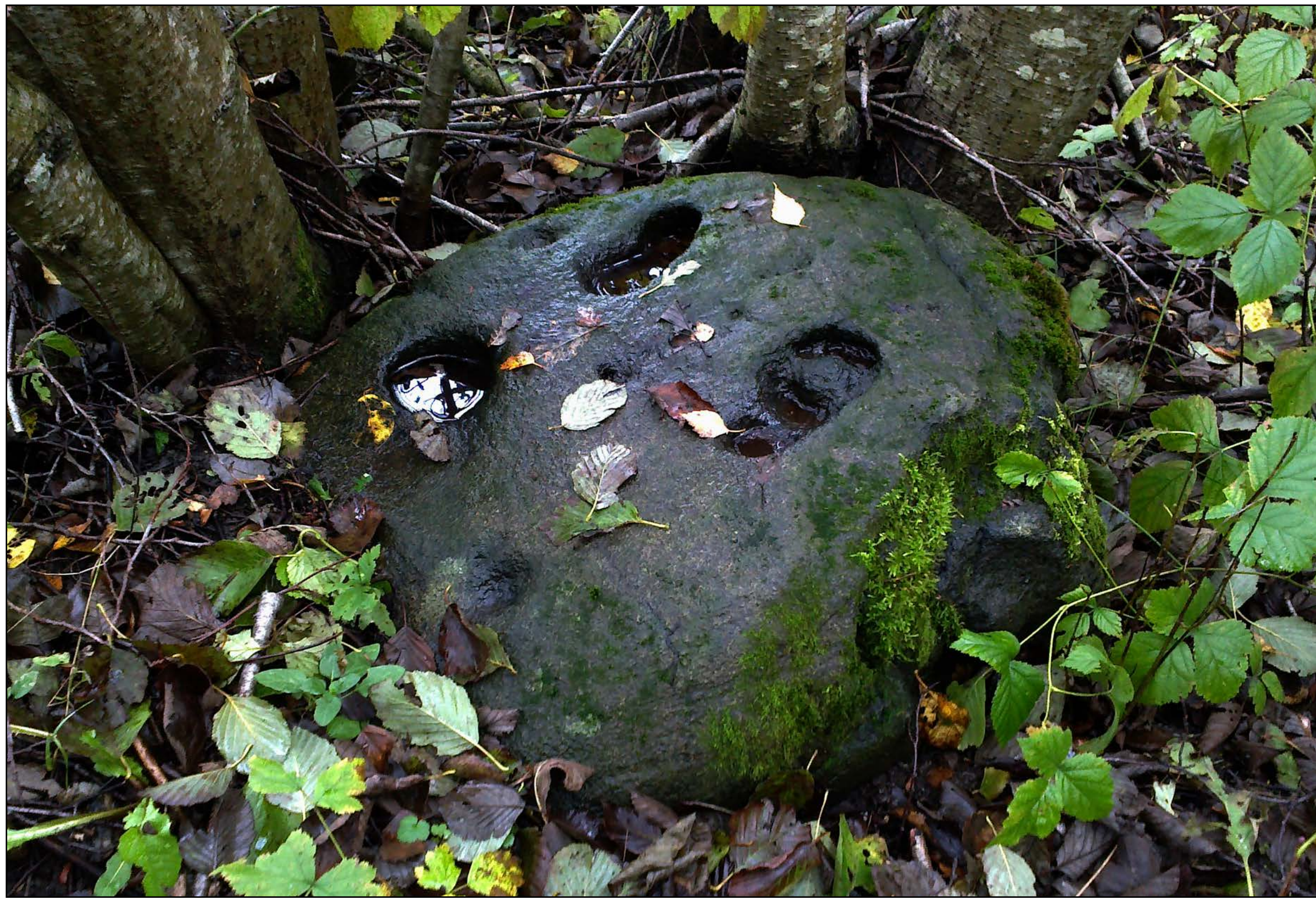
Inimese ja hundi jäljega kivi